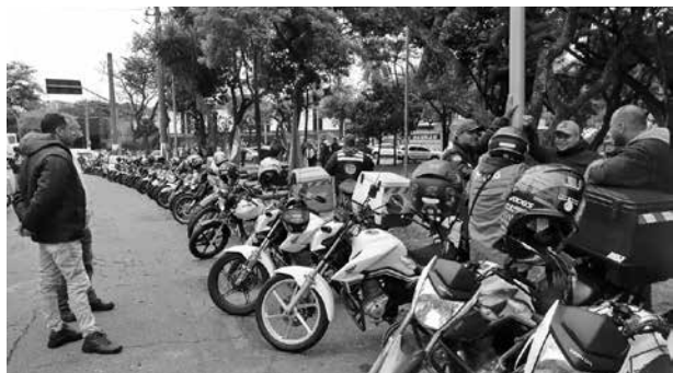
Objetivo é impulsionar o financiamento de veículos

Nesta edição do Focus , a estimativa dos analistas de mercado para a taxa básica de juros até o fim de 2026 subiu de 13,25% ao ano para 13,5% ao ano. Para 2027 e 2028, a previsão é que a Selic seja reduzida para 11,5% ao ano e 10% ao ano, respectivamente. Em 2029, a taxa deve ficar em 10% ao ano.