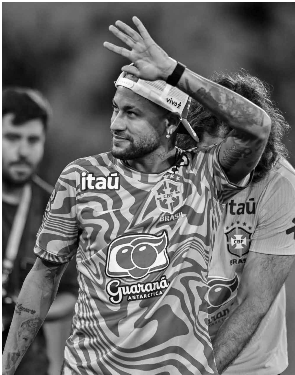
Aos 34 anos, Neymar, mesmo em baixa tecnicamente, está no topo com 20 contratos

De uma geração mais atual, Endrick, aos 19 anos, já acumula seis parcerias: Gillete, New Balance, Red Bull, Hypera/Neosaldina, Sicoob e EA Sports. Recentemente, o atacante fechou um acordo pontual para o Mundial com a Gillete. Um vídeo postado nas redes sociais do jogador, em collab com a empresa, já conta com mais de quatro milhões de views nos reels do Instagram. A convocação do treinador Carlo Ancelotti para a Copa do Mundo fez com que pelo menos oito atletas da Seleção Brasileira assinassem novos contratos de patrocínio visando a disputa do torneio que será realizado nos Estados Unidos, no México e no Canadá.