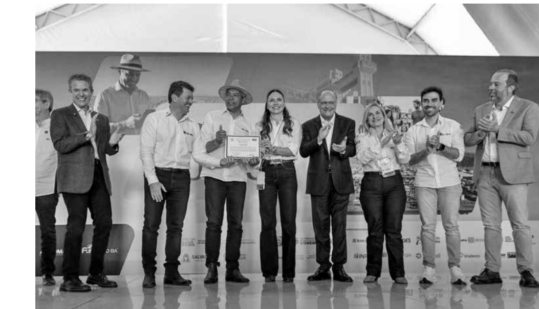
Comitiva do vice-presidente Geraldo Alckmin detalha investimentos no fortalecimento do setor

Durante a solenidade, o governador da Bahia, Jerônimo Rodrigues, destacou a importância da Bahia Farm Show como espaço de diálogo