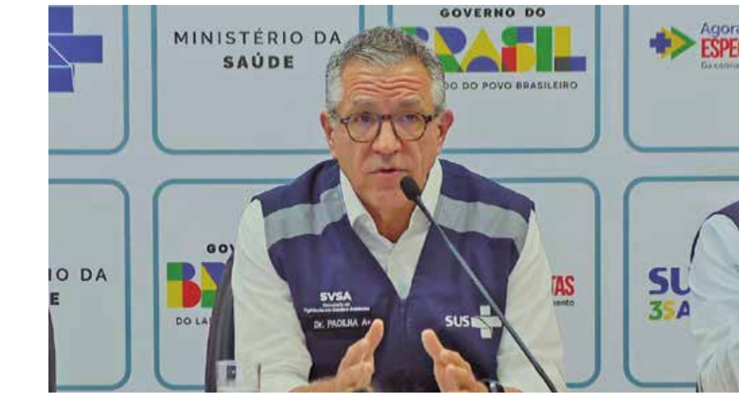
Ministro da Saúde, Alexandre Padilha, durante anúncio, na tarde de ontem, na TV

panhamento especial para identificar se pessoas que tomaram a vacina acabaram desencadeando sinais de alerta ou reação adversa. “Os 42 casos significam