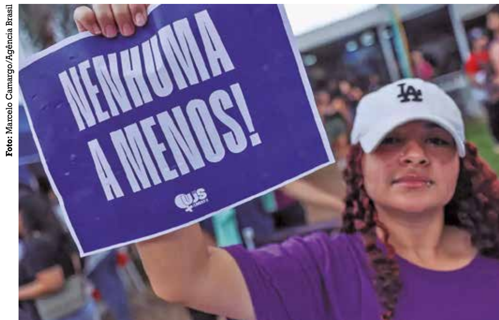
As agressões afetam mulheres de todas as classes sociais, etnias e regiões brasileiras

Começou a vigorar ontem, no programa A Voz do Brasil , um minuto da programação diária — dentro do tempo reservado à Câmara dos Deputados — para divulgar serviços de enfrentamento e prevenção à violência contra as mulheres.