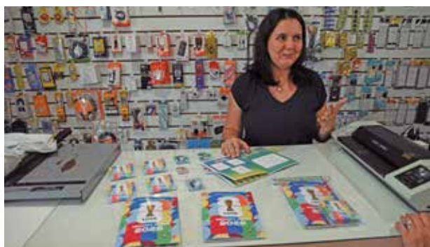
Papelaria lançou álbum de figurinhas com fotos de casal