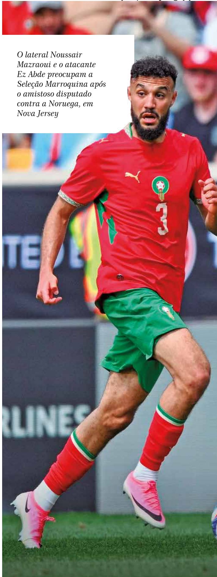
O lateral Noussair Mazraoui e o atacante Ez Abde preocupam a Seleção Marroquina após o amistoso disputado contra a Noruega, em Nova Jersey