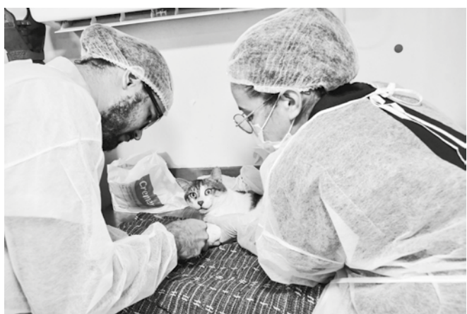
Programa estadual tem castração gratuita para cães e gatos

No município de Guarabira, o Castramóvel estará instalado na Escola Cidadã Integral (ECI) José Soares de Carvalho, no bairro Primavera, também