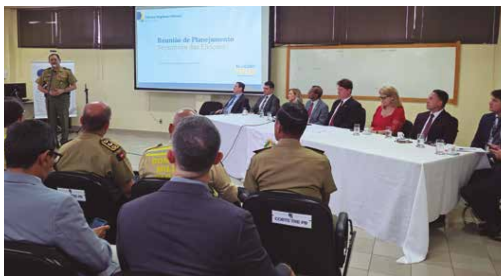
Instituições buscam garantir a normalidade e a tranquilidade das eleições de outubro

O encontro foi conduzido pelo presidente do TRE-PB, o desembargador Márcio Murilo da Cunha Ramos, que ressaltou que a reunião foi um momento de ouvir as autoridades ligadas à segurança no estado e debater a melhor forma de atuação conjunta e estratégica. “Queremos aprimorar ainda mais os mecanismos de fiscalização, inclusive ampliando o acesso aos sistemas de monitoramento por câmeras em todo o estado, para acompanhar o fluxo de eleitores e agir pron-