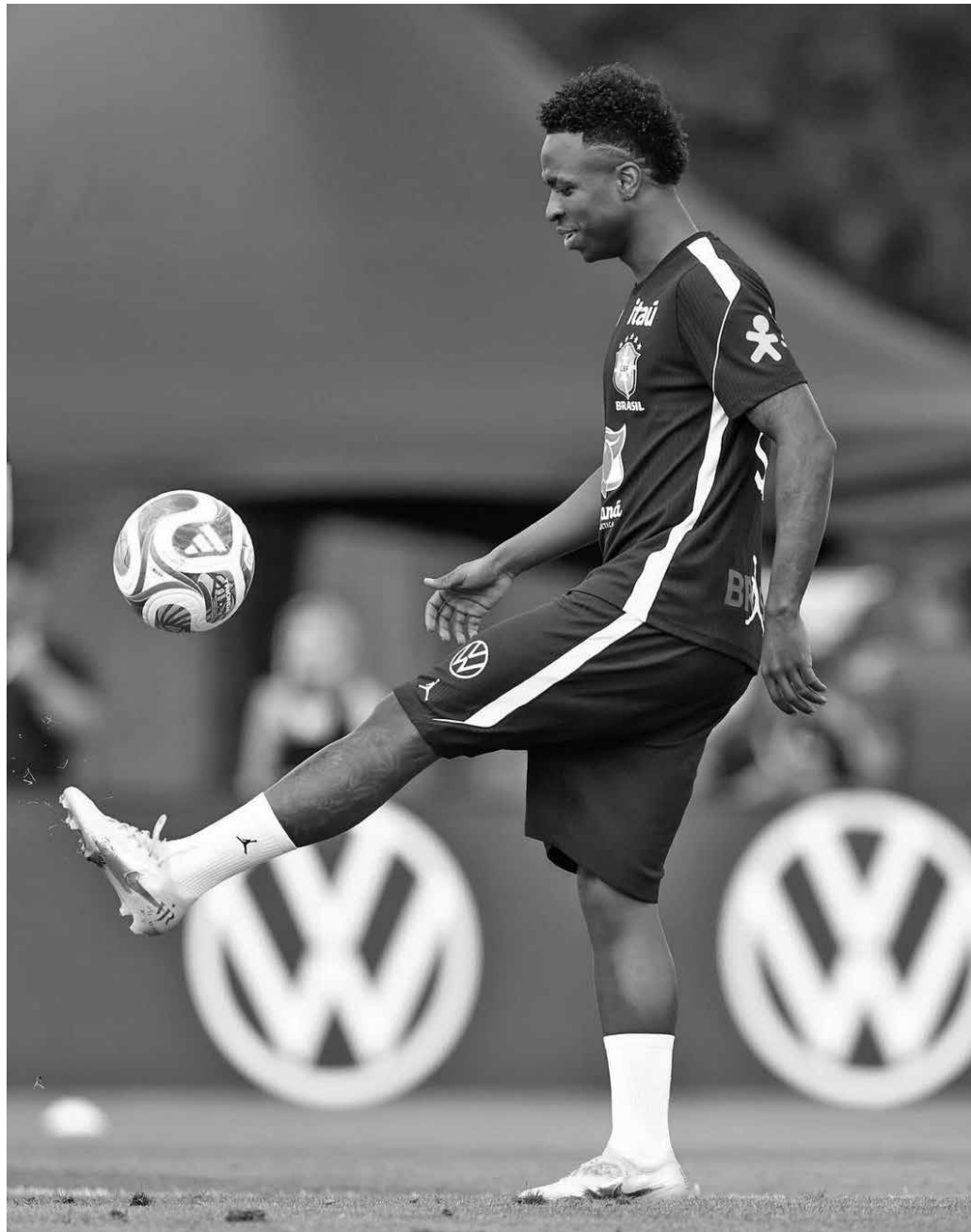
O atacante Vinicius Júnior aparece em segundo lugar com a marca de 16 patrocinadores