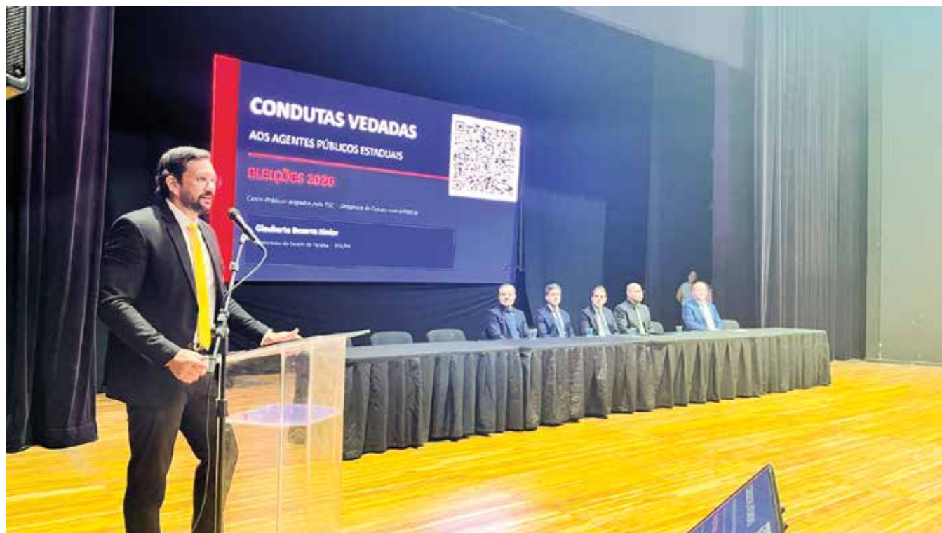
Valorizando a transparência, a iniciativa prioriza o fortalecimento das práticas preventivas na administração pública

“A Procuradoria-Geral do Estado da Paraíba tem um compromisso com a defesa da legalidade e de um pleito equilibrado. Estivemos há