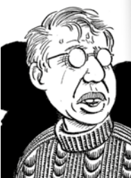
Autorretratos: Marjane Satrapi, Art Spiegelman e Joe Sacco